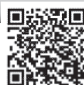
制度の詳細 (大阪府ウェブサイト)

「かかりつけ医」からの紹介状を持って受診していただくことに重点をおいた医療機関を指します。患者様はまず「かかりつけ機能を担う医療機関（診療所・病院など）」を受診され、必要に応じて紹介を受けて紹介受診重点医療機関を受診する。その後、状態が落ち着いたら逆紹介を受けてかかりつけ医に戻る、という受診の流れが明確化された国の医療施策となります。