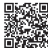
「選定療養費」の詳細 (PL病院ウェブサイト)