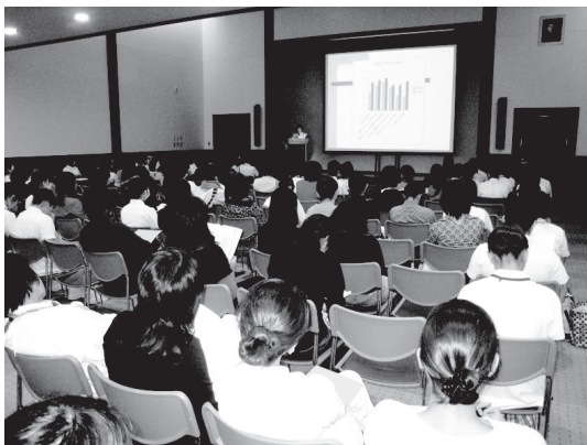
昨年12月12日に院内で行われた看護研究発表大会の様子は、8演題の発表がありました。これ以外にも各地の学会などで、数多くの発表を行っています。